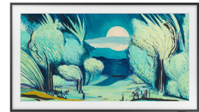
The Frame 2025